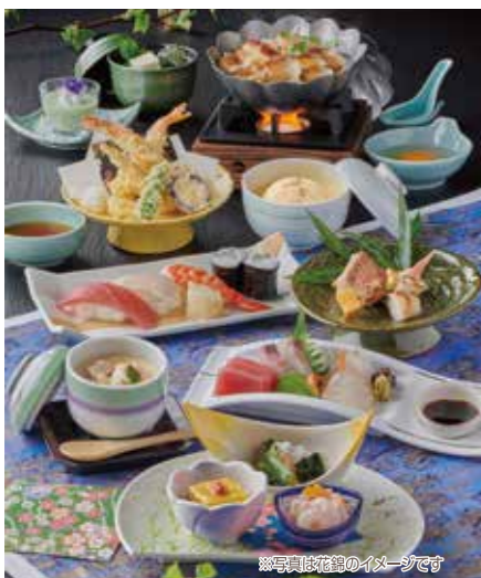
※写真は花錦のイメージです