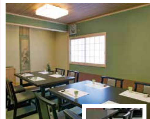
個室から広間までございます