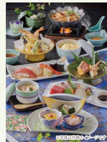
※写真は花錦のイメージです