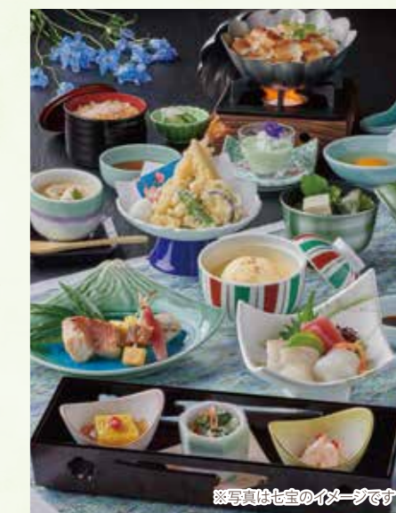
※写真は七宝のイメージです