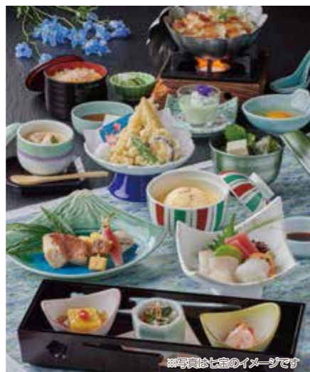
※写真は七宝のイメージです