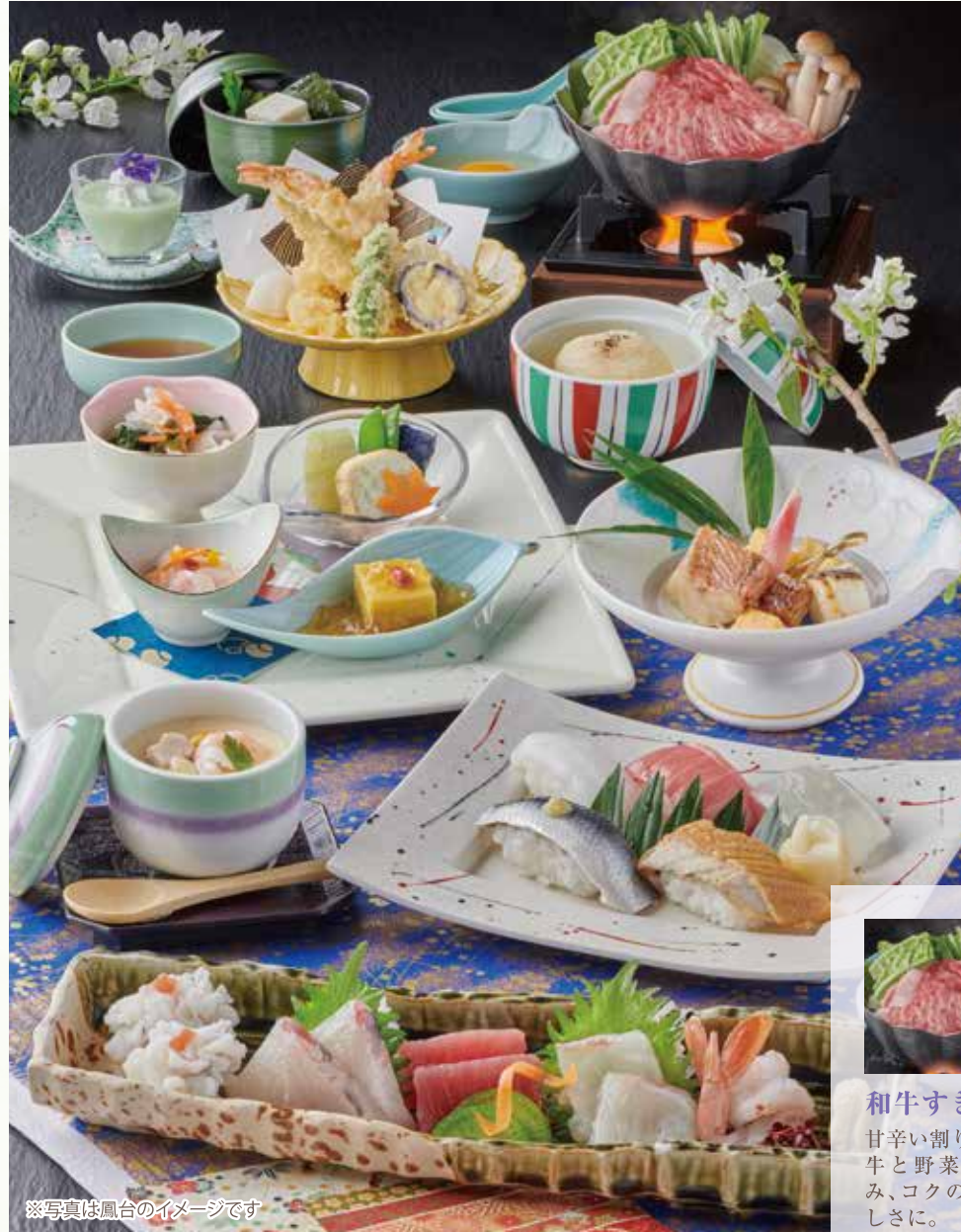
※写真は鳳台のイメージです

旨味にこだわった「出汁」に、旬の食材を活かす職人の「技」。音羽の季節感あふれる味覚会席をご堪能ください。