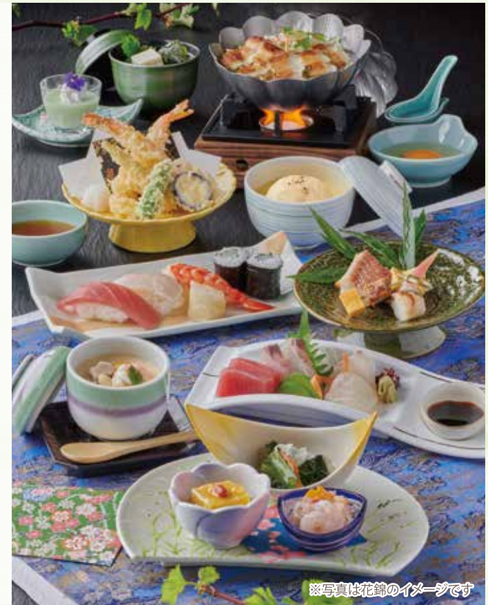
※写真は花錦のイメージです