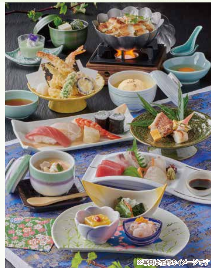
※写真は花錦のイメージです