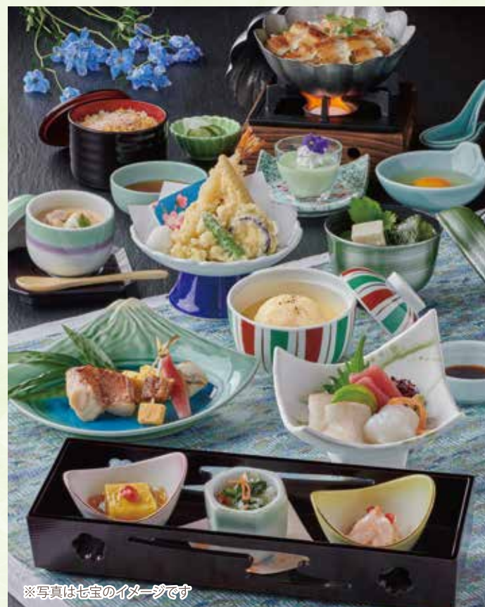
※写真は七宝のイメージです