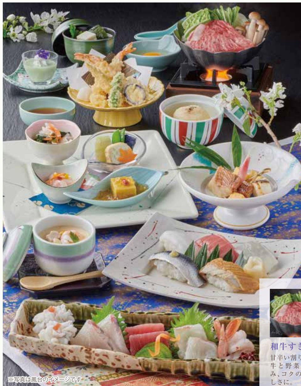
※写真は鳳台のイメージです

旨味にこだわった「出汁」に、旬の食材を活かす職人の「技」。音羽の季節感あふれる味覚会席をご堪能ください。