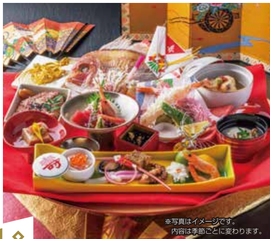
※写真はイメージです。内容は季節ごとにより変わります。