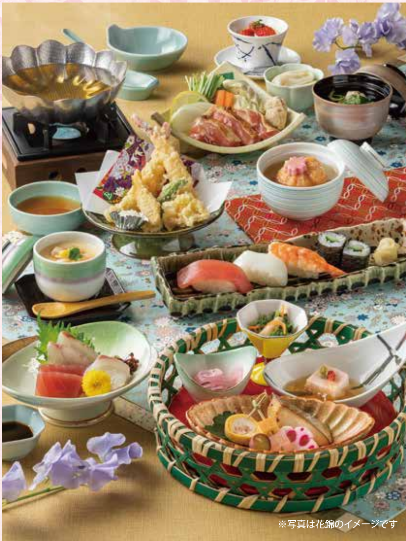
※写真は花錦のイメージです