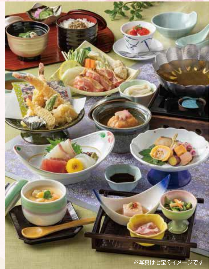
※写真は七宝のイメージです