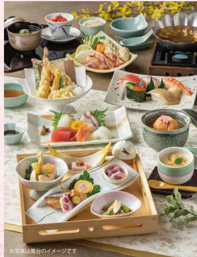
※写真は真鶴のイメージです