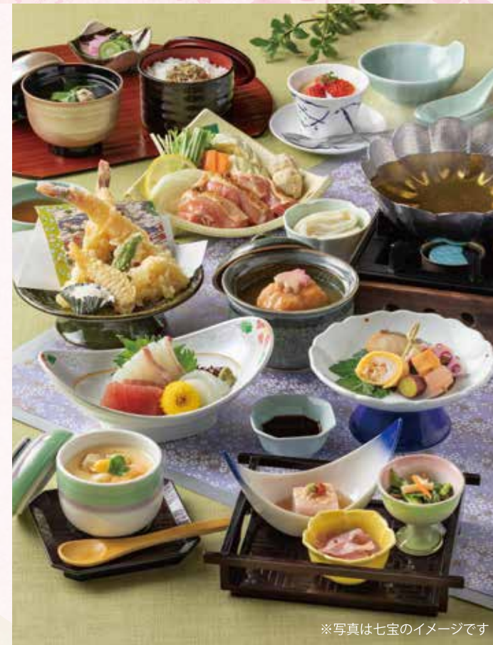
※写真は七宝のイメージです