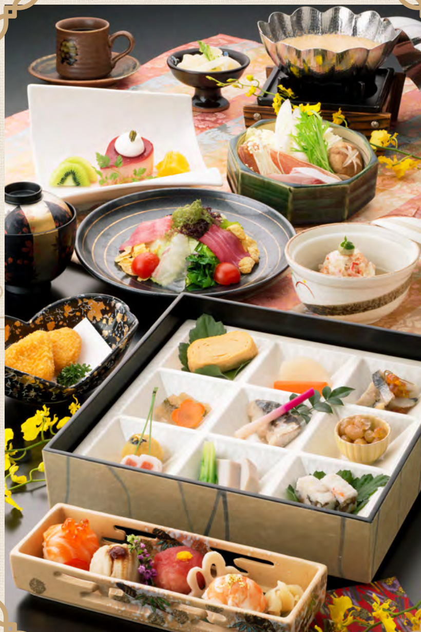
※写真は、「姫室」のイメージです。