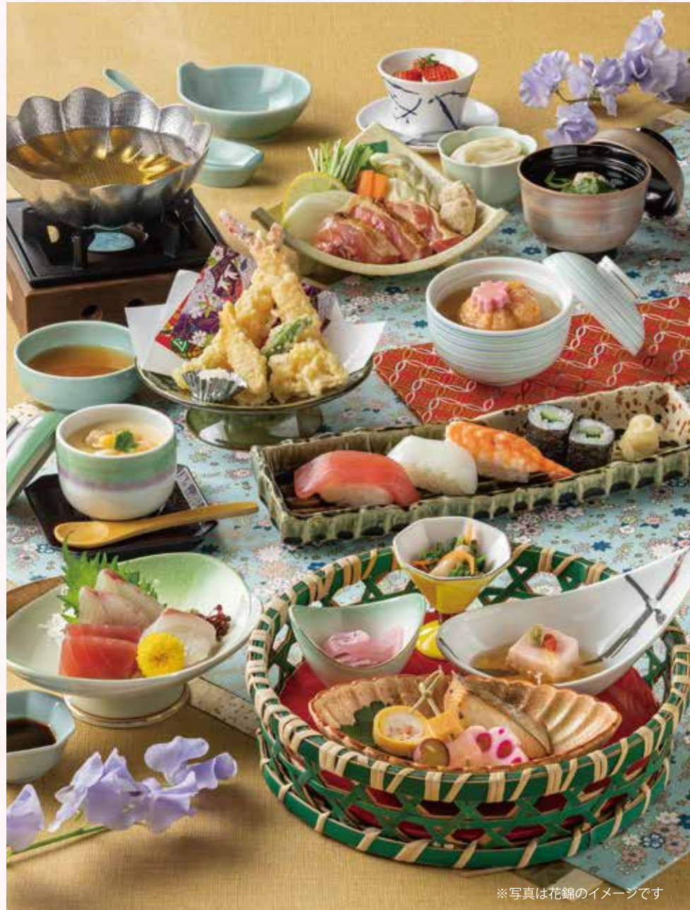
※写真は花錦のイメージです