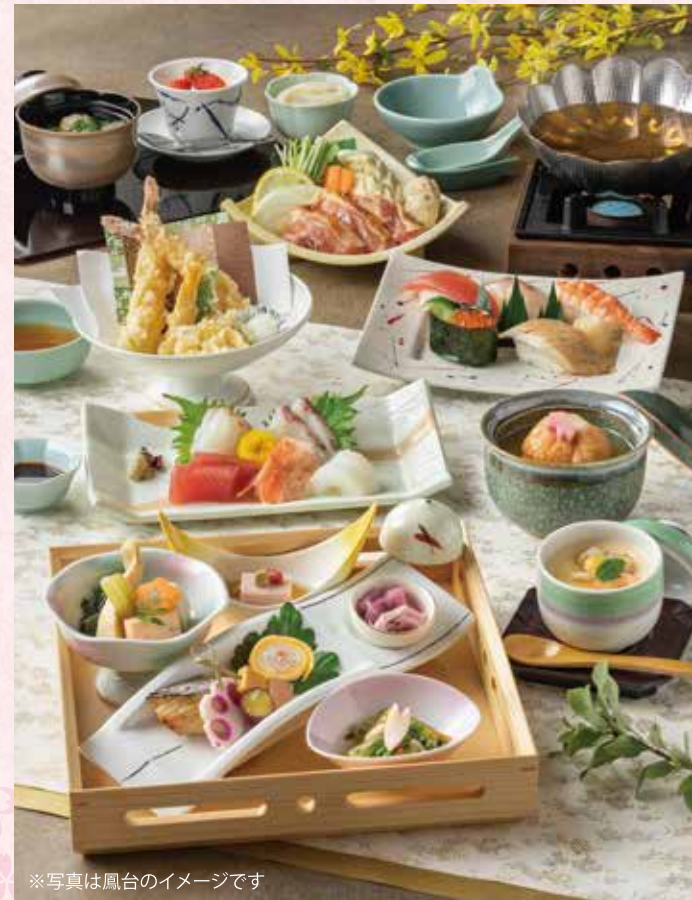
※写真は鳳台のイメージです