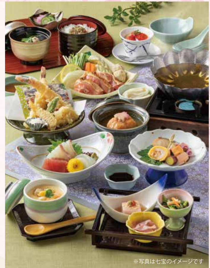
※写真は七宝のイメージです