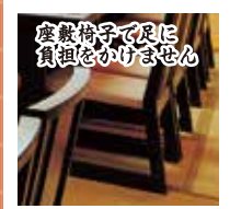
座敷椅子で足に 負担をかけません