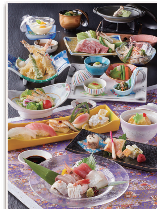
※写真は鳳台のイメージです