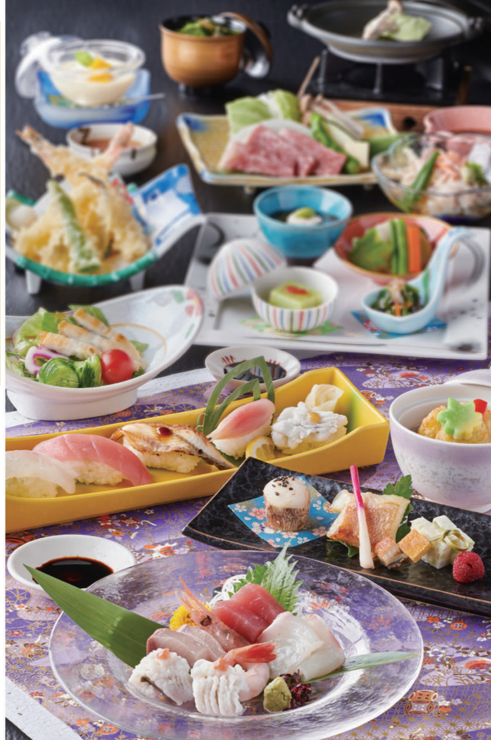
※写真は鳳台のイメージです。詳細は中面をご覧ください