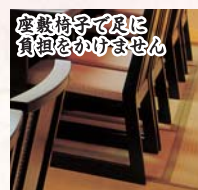
座敷椅子で足に負担をかけません

様々な設備をご用意しております 足の不自由な方やお年寄りにも安心してご利用いただけます