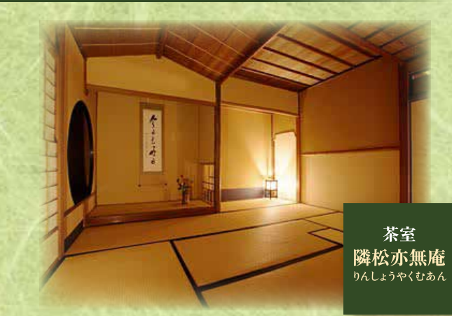
茶室 隣松亦無庵 りんしょうやくむあん