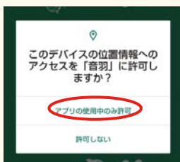
②位置情報への アクセス確認