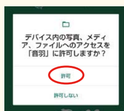
③メディア・ファイルへの アクセス確認