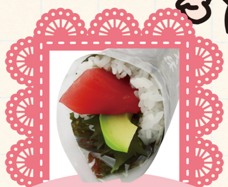
鮭アボカドの花手巻